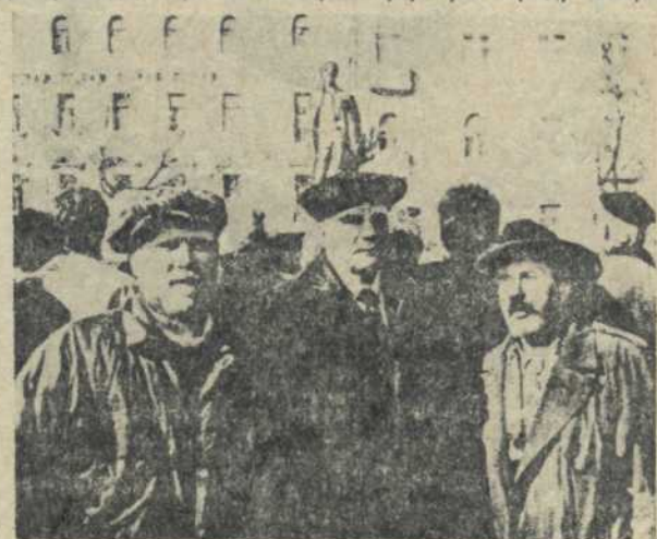
Открытие памятника С. Есенину в Москве.