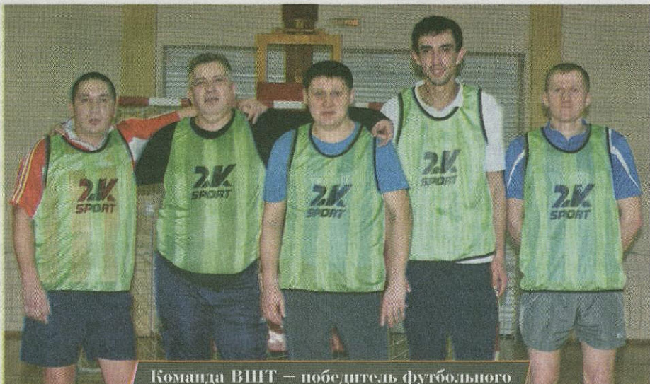
Команда ВШТ — победитель футбольного этапа шахтовой спартакиады