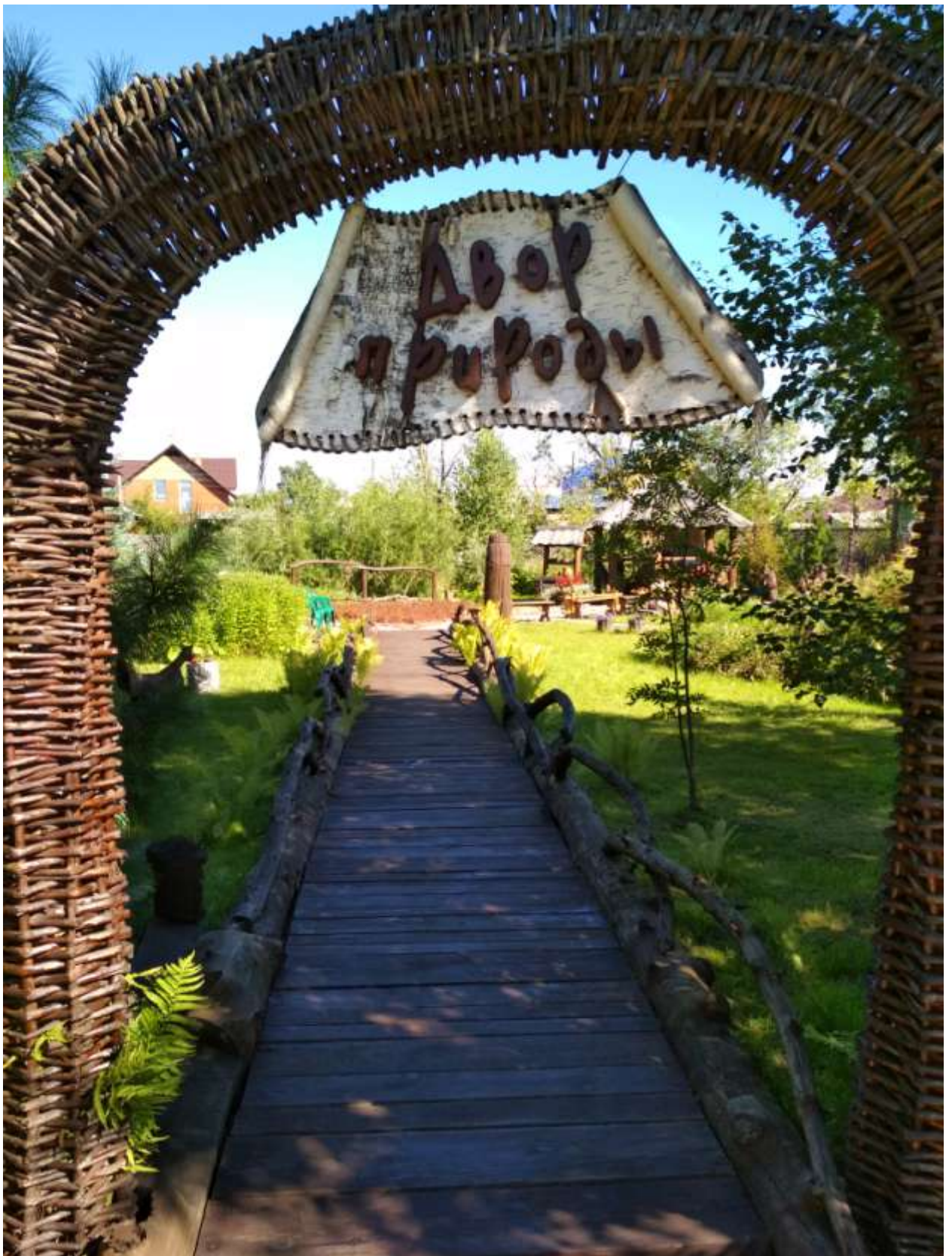
Двор природы при литературно-мемориальном музее В.А. Чивилихина