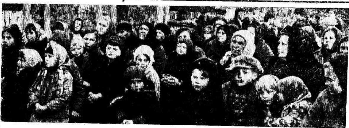
На снимках: на открытии агитплощадки на улице Чернышевского.