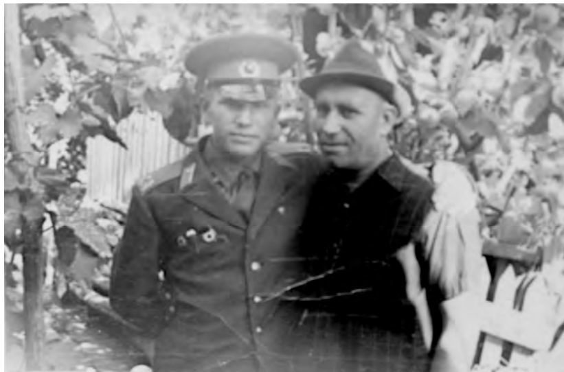
Вулканешты, июль 1971 г.