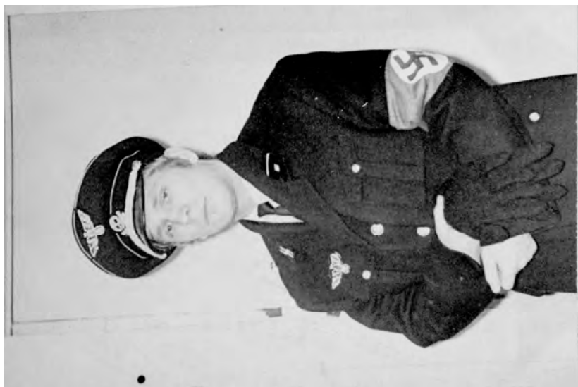
Кемерово, 1970 г. В роли немецкого офицера