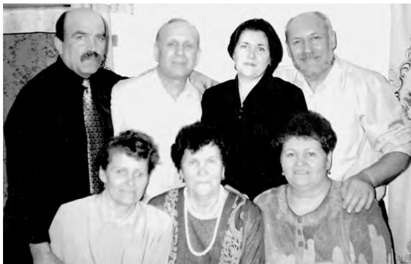
Калининский, 14 марта 2002 г.