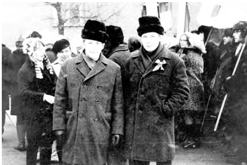
Кемерово, 7 ноября 1970 г.