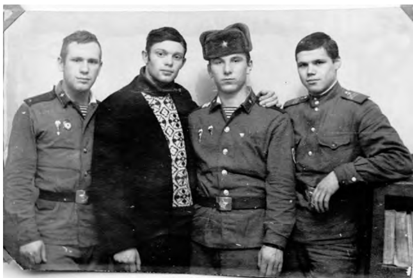
Болград, ВДВ, декабрь 1972 г.