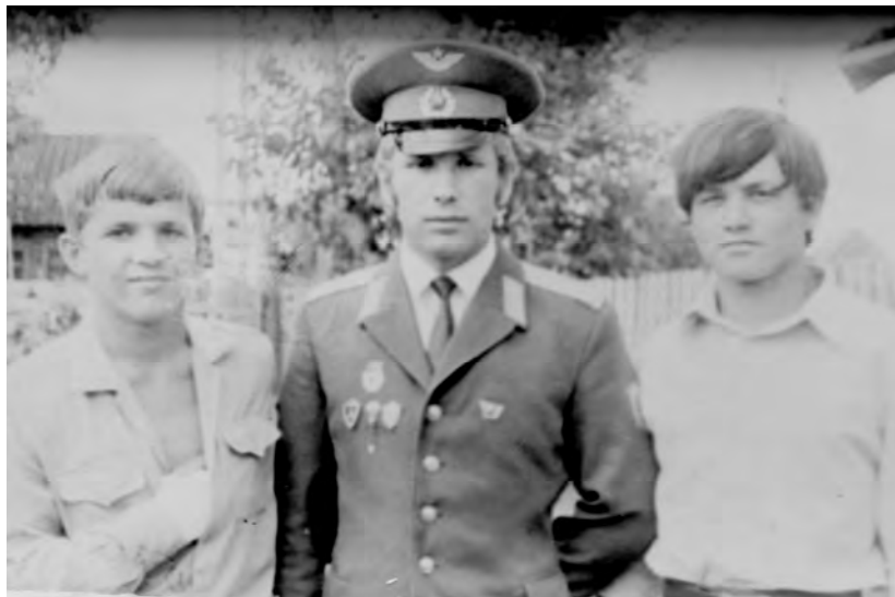
Пудино, июль 1973 г.