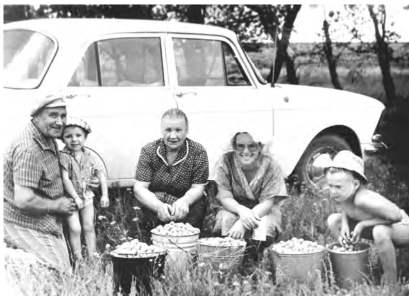
Вулканешты. За сбором жердел.