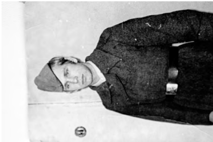
Кемерово, 1970 г.