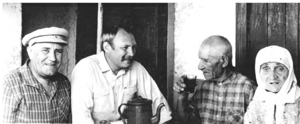
Владичень. В гостях у деда Вани.