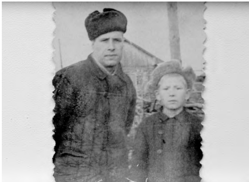
Калининск, 1963 г.