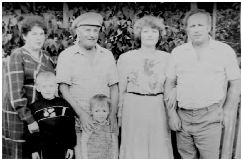
Вулканешты, июль 1990 г.