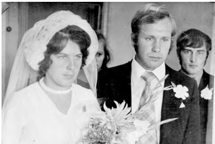
Свадьба, сентябрь 1976 г.