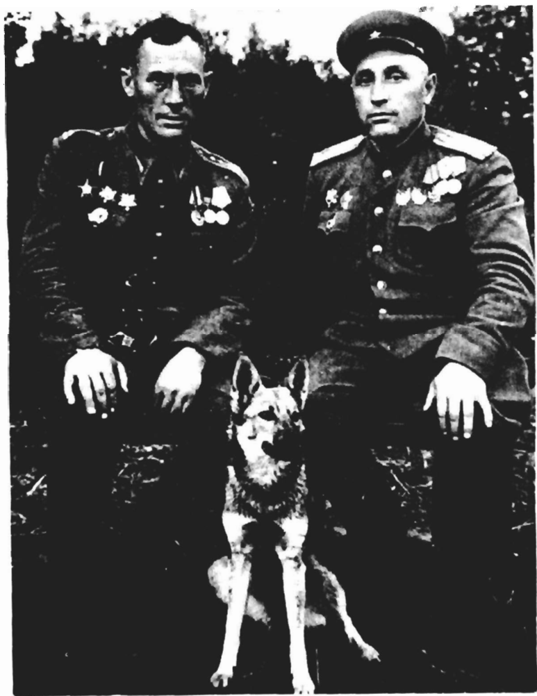
В Турувском лесу. «Нынче у нас передышка, завтра вернемся к боям...»