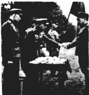
Н. Г. Ушаков вручает награды участникам боев на Вислинском плацдарме. Сибиряки и здесь не ударили в грязь лицом...

Р.К.У.С. Дорогие Лизочка и Светлана! Сегодня дорожке мои получили результаты отидания сна- чала решено было оставить меня в тылу и должности были на выборы, но вيرا получила приказание от генерал-полковника Козако- ва, направить меня в рас- поряжении Гомельского. Завтра еду. Получил зван- ие полковника. Получил звание бригадироваии шимель, пата- товоб алье, Ятары шеретам колок, пераотак, ситоми грон