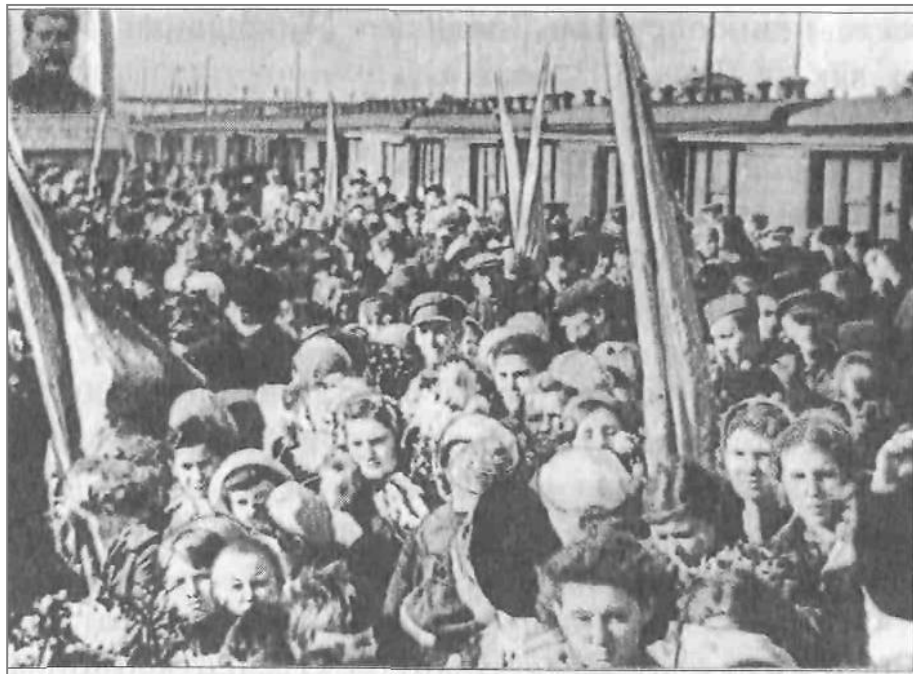
Проводы на фронт добровольцев-сибиряков, 1942 г.

После излечения попал в дивизионную разведку. За то, что успешно захватили «языка» с ценными сведениями, получил второй орден Красного Знамени».